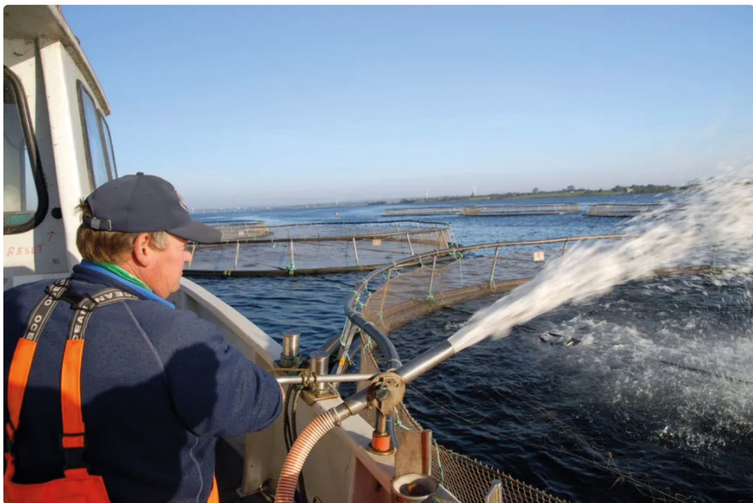
Aquapri blev grundlagt i 1900. Det skete i Glyngøre.

Selskabet blev etableret i 1890 og holder til i Frederiksværk.